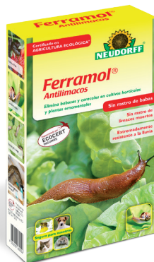
Ferramol® Antilimacos *(2)