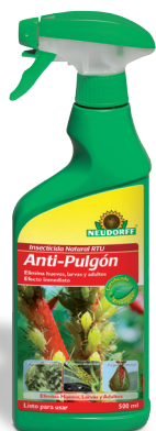
Anti pulgón Insecticida Spruzit® RTU *(3)