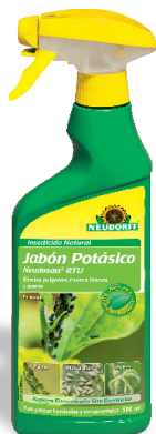
Insecticida Natural Jabón Potásico Neudosan® RTU *(3)